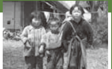
弟妹の子守り 昭和30年頃