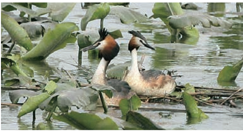
2012年福島潟で初確認された巣

水に潜っては魚を捕って食べるカイツブリという水鳥が福島潟にいます。地元では「ミヨセ」と呼ばれ、昔から親しまれています。ハトより小柄ですが「びるるるる」と転がすように鳴く声はよく通ります。