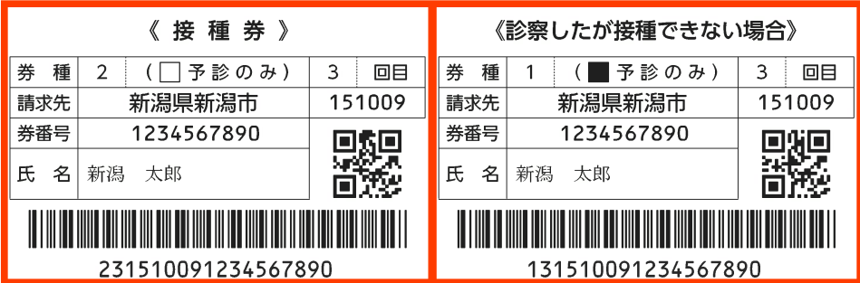
《新型コロナウイルスワクチン予防接種済証(臨時接種)》 Certificate of Vaccination for COVID-19

2回目を集団接種で受けた65歳以上の方には、3回目の指定日時・会場が記載されています。