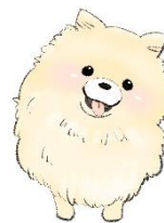
中央区ヘモグロビン エーワンシー普及犬 エワン