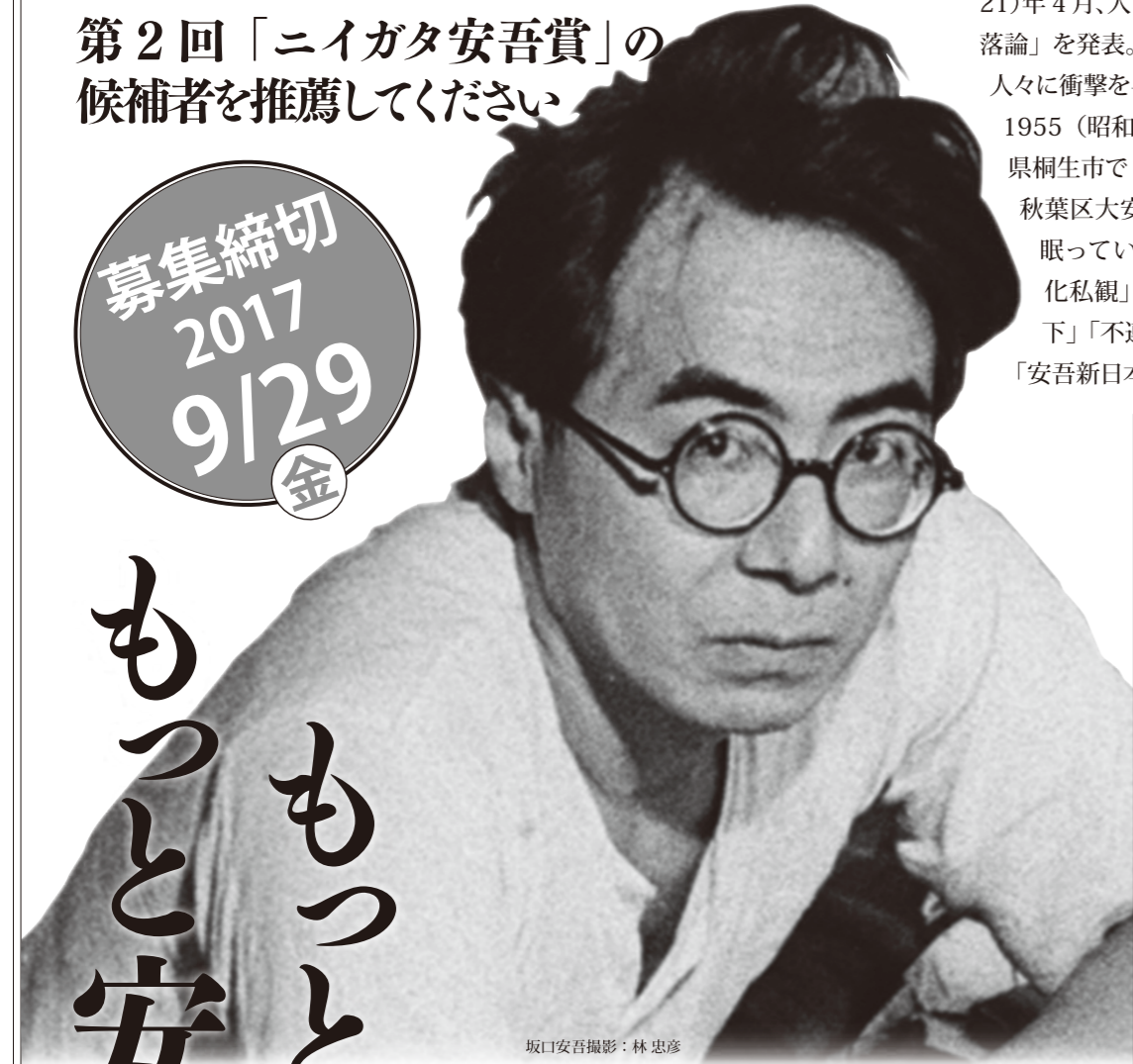
坂口安吾

坂口安吾は 1906（明治 39）年 10 月、新潟市西大畑町に生まれる。1931（昭和 6）年に発表した「風博士」、「黒谷村」で新進作家として認められ、1946（昭和 21）年 4 月、人間の本質を鋭くえぐった「墮落論」を発表。焼け跡の廃墟にたたずむ人々に衝撃を与えた。