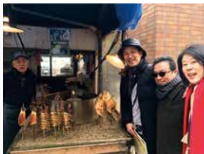
可歩き：人情横町にて