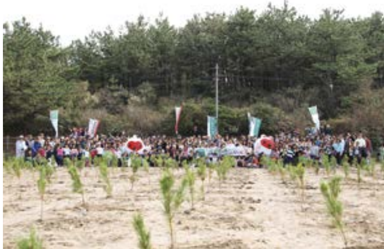
市営汐見台住宅跡地 区民協働によるクロマツの植樹