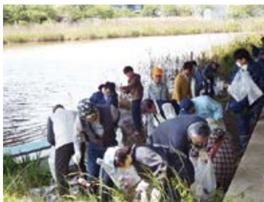
鳥屋野潟一斉清掃