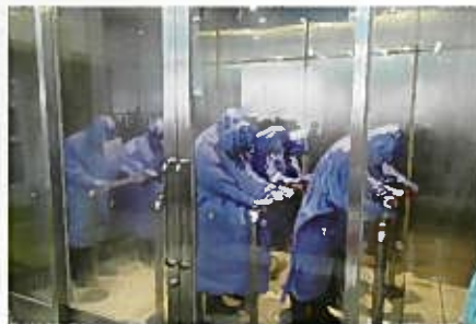
風雨災害体験コーナーでは30mの雨・風の凄さを体験します。あの風が吹いた時には何が飛んできて凶器になると思ひます。風雨が強くなる前に避難をするべきだと思ひました。