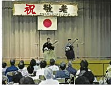
恒例の小林組。熱演で拍手喝采