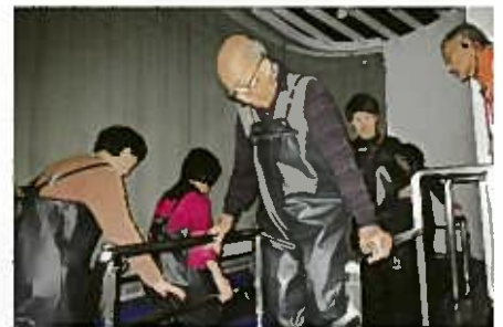
洪水体験コーナーは15・30・45cmの流れる水の中を歩きます。深くなるほど水圧が凄く、流れが速くなれば足が流されるのではと怖くなる体験でした。