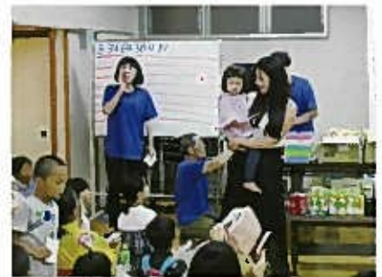
ビンゴ大会は今年も人気