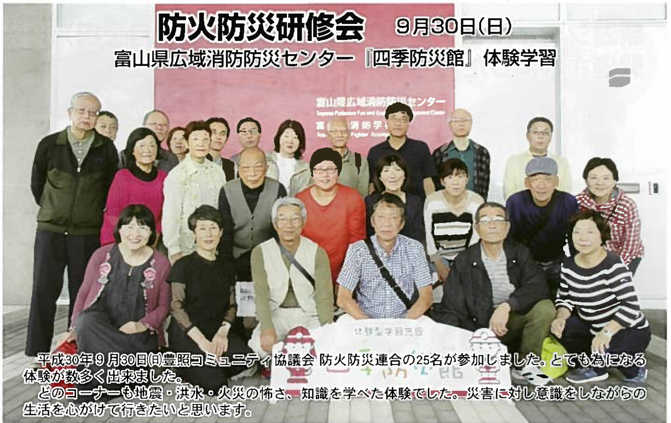
平成30年9月30日(日)豊照コミュニティ協議会 防火防災連合の25名が参加しました。とても為になる体験が数多く出来ました。どのコーナーも地震・洪水・火災の怖さ、知識を学べた体験でした。災害に対し意識をしながらの生活を心がけて行きたいと思ひます。