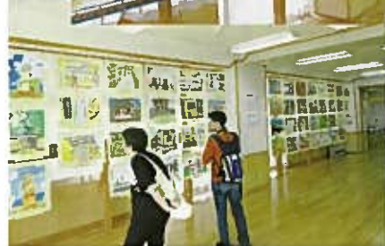
熱心に作品を見えています