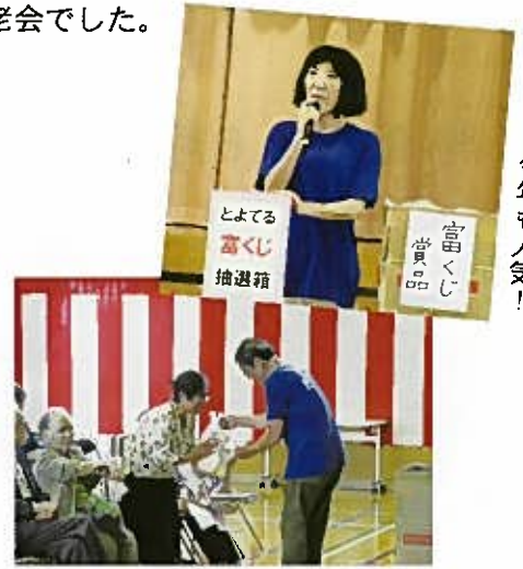
富くじは今年も人気!