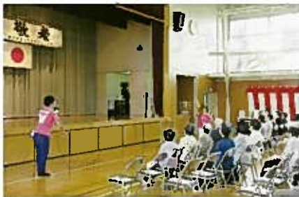
なまらエンターテイメントは今年で 2回目です(アトラクション)