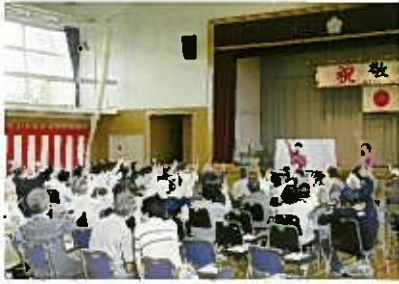
今年はジャックポットさんが 出演してくれました