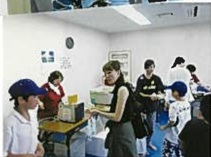
今年も新潟柳都中からボランティアの応援をいただきました