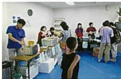
生ビールもあります