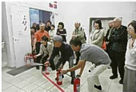
初期消火体験コーナーは火事のスクリーンにむかって放水します。火の先端に放水しても火は消えません。火元をしっかり狙います。