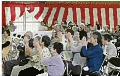
アンコールもありました