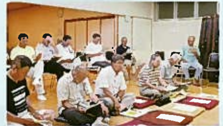
各町内会より代表が来てくれました