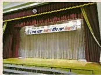
ステージには今年の標語「キャッチユアハート ギブアワーハート」