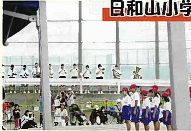
隣の新潟柳都中の生徒がファンファーレで開会を祝ってくれました