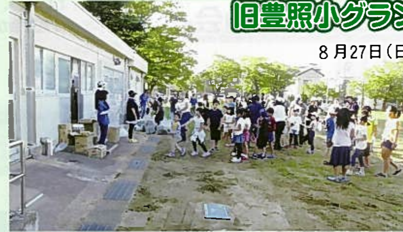
各自治・町内会より大勢参加頂きました!