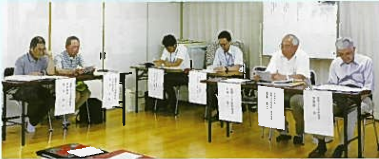
行政担当者より説明がありました