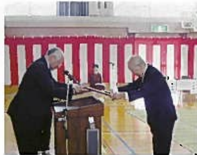
鹿島新会長より小松顧問へ。ありがとうございます

台風18号が通過した直後の為、例年より少ない敬老者の参加となりましたが、とても楽しんでくださいました。