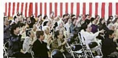
ゲー、チョコキ、パー