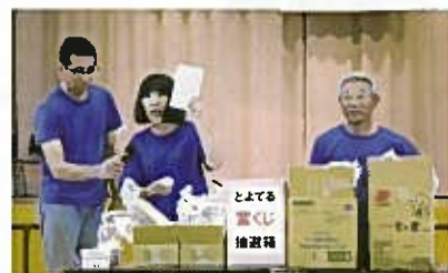
「皆さんあたりです！」