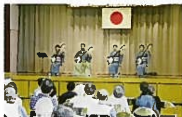
恒例の小林組の演奏