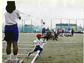
チビッコが一番速かった!