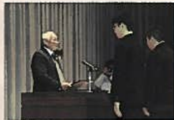
鹿島会長より感謝状の贈呈