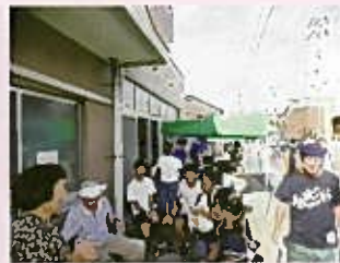
集会所とよてる前の様子です 綿あめが美味しそうだね