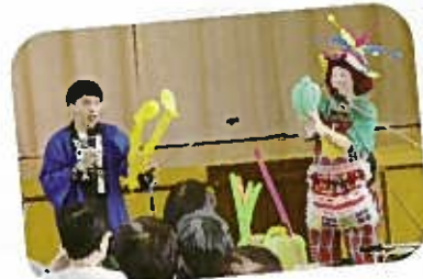
新潟お笑い集団NAMARA (ナマラ) のパフォーマンス

台風18号が通過した直後の為、例年より少ない敬老者の参加となりましたが、とても楽しんでくださいました。