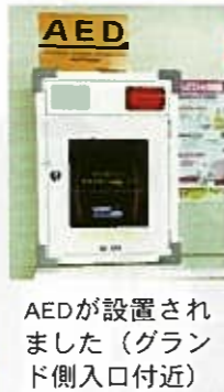
AEDが設置 されました(グランド 側入口付近)