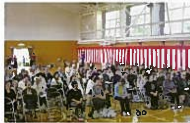
足もとの悪い中、大勢の方が集まってくださいました