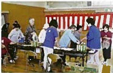
ドリンクをどうぞ!