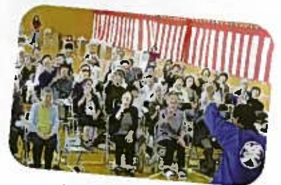
チョコキでした～(笑)