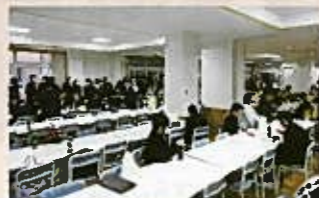
柳都うどんは今も人気! (1Fランチルーム)