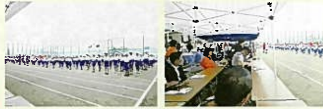
赤組、白組で競いました