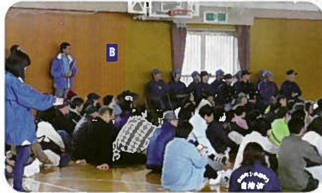
地元消防署・消防団