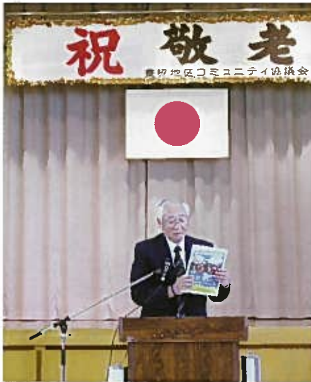
鹿島会長より10月からの豊照体育館の利用案内がありました