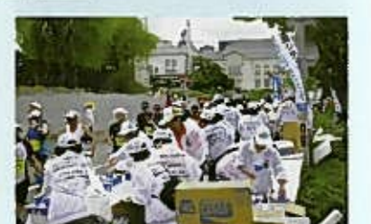
旧豊照スポーツ振興会・青年部・婦人部の皆さんがボランティアとして頑張っています。