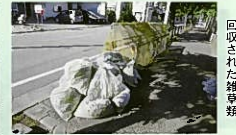
回収された雑草類