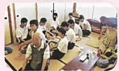
新潟柳都中の3年生です