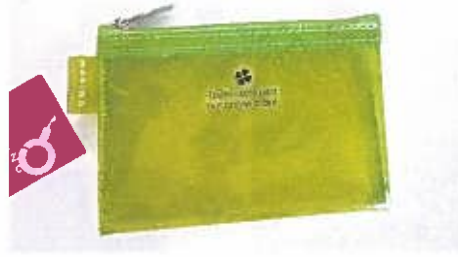
2年度目取り組み携帯用情報カード 配布事業