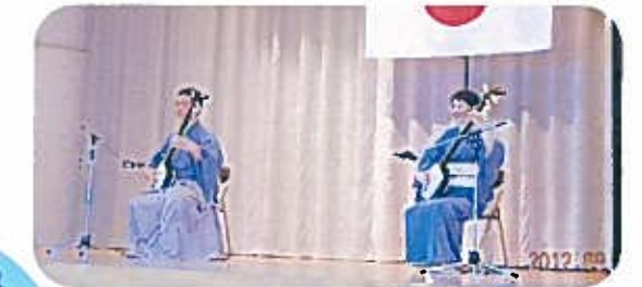
小林座の津軽三味線演奏