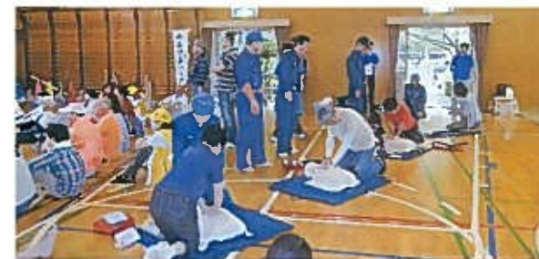
皆で参加 防災訓練を行います