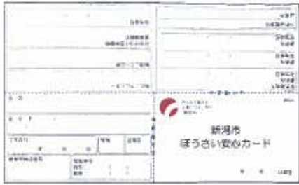
携帯用情報カード (安心カード)