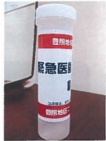
緊急医療情報キット配布取り組み