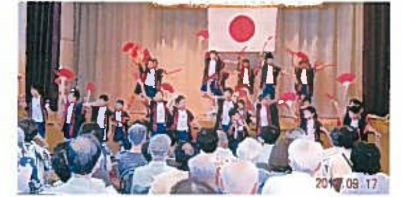
豊照小児童による総おどり演舞

例年敬老の日に豊照小学校体育館にて実施します。地域の75歳以上の敬老者に案内されます。200名以上の参加者があります。