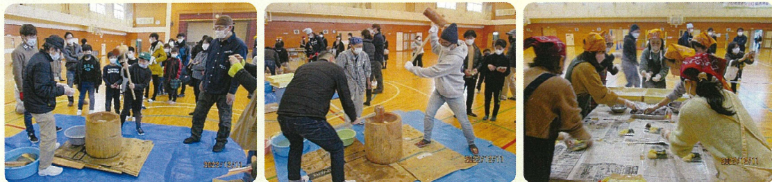
鳥屋野1丁目 ～鳥屋野南自治会 合同の餅つき大会

同日、大島自治会でも自治会館で餅つき大会が行われ、親子で餅つきを楽しむ姿が見られて大変微笑ましい年末行事となりました。