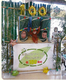
鳥屋野逆さダケの藪 特別展示 3年生の発表パネル

今回は感染対策上、豚汁の振る舞いや食品販売、移動販売車などの飲食を伴うコーナーは設けず、子どもたちが喜ぶ人気アトラクションを中心に午前中のみに縮小して行いました。