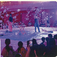
ステージイベント シャボン玉ショー 新潟を中心に活躍の「泡人」さんのパフォーマンス、幻想的な空間でした。