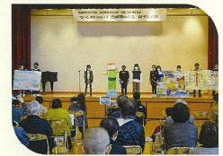
鳥屋野小3年の皆さんによる発表