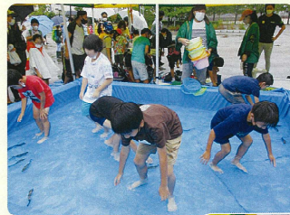
大人気の ニジマス つかみどり ハッスルすぎて転倒する子も！どの子もニジマスを追い詰めるのに必死です。