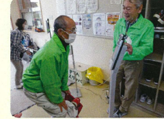
受付で手指消毒と検温を実施