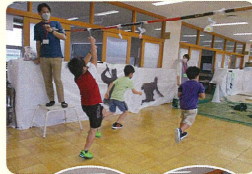
不動の人気アトラクション 鳥屋野 SASUKE 夢中でジャンプ、全速力で駆け抜ける子どもたちの楽しげな様子が印象的です。