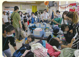
初開催の 赤ちゃん誕生お祝い会 おさがり交流会 鳥屋野コミュニティスクールの企画で、入学前世代のご家族のふれあいの場として行われました。おさがりのコーナーは大盛況でした。