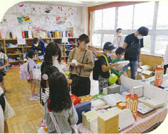
いいものたくさん！ 寄付品販売 掘り出しものあったかな～