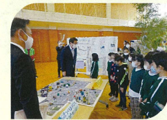
総合学習で取り組んだ「地域のお宝発見」について中原市長にお話しました。