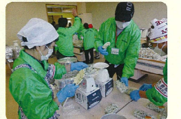
給食給水部による炊き出し訓練