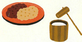
大島自治会餅つき大会

同日、大島自治会でも自治会館で餅つき大会が行われ、親子で餅つきを楽しむ姿が見られて大変微笑ましい年末行事となりました。