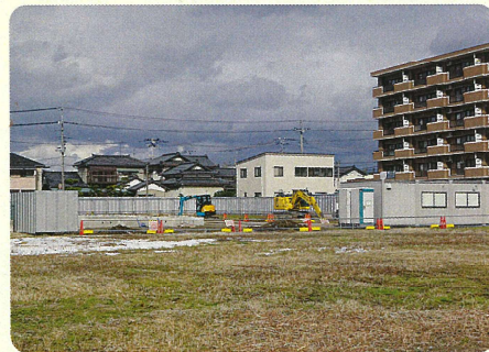
工事が始まった跡地