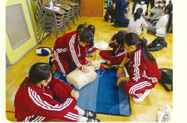
上山中学校学生支援隊も参加