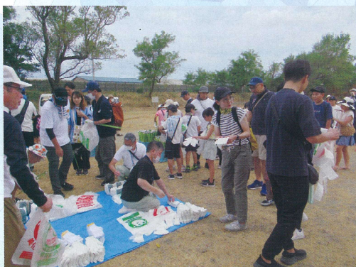
清掃の用具をもらって、いざ出発です。

昔からのなじみのある海岸なので、いわば当たり前にある海岸なのですが、関屋地区だけではなく、海から離れた市内や県内から海水浴に訪ねてくる海岸であり、関屋地区の誇りとして白慢していい海岸です。地域の誇りを守るためにも、皆様からの応援を今後ともお願いいたします。