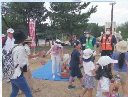
お疲れ様の麦茶配布です。