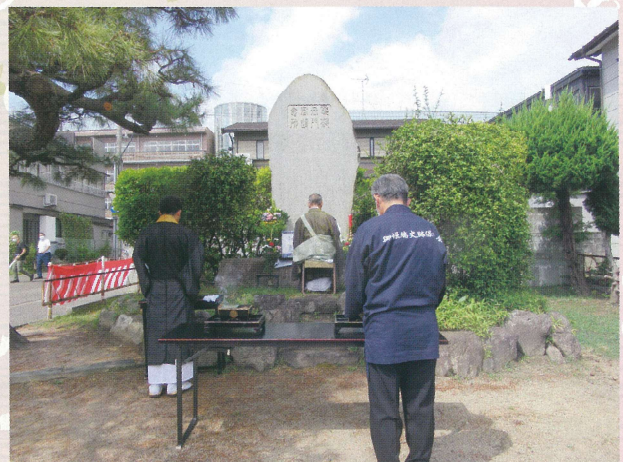
念仏寺住職の読経と参加者の焼香