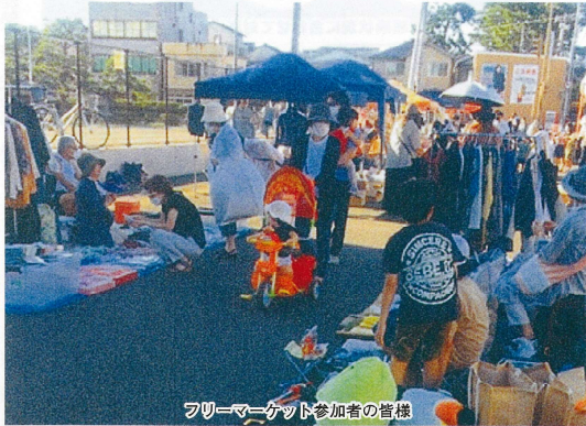
フリーマーケット参加者の皆様