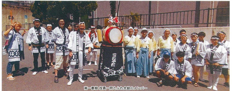
南一番組 役員一同とふれ太鼓のメンバー