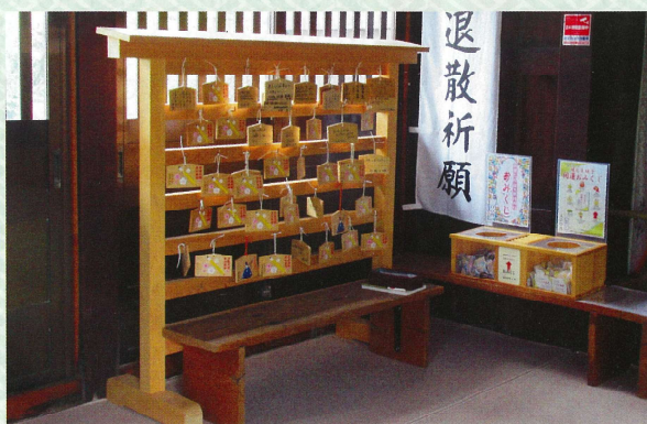
今年の受験生の絵馬

以降は周囲二百米の地域内に県立高校が3校、五百米地域内では大学、短大、専門学校、私立高校、小中学校など合わせると10校を超える学舎があり全国的にも稀にみる屈指の学園地域で所在地名も学校町商店街中心部に鎮座しています。 近年は学生及び各種受験者の合格祈願の神社として慕われ地元受験者及び県内各地からも多数の参拝者が訪れております。