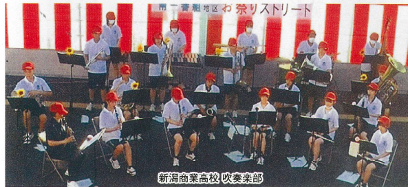
新潟商業高校 吹奏楽部