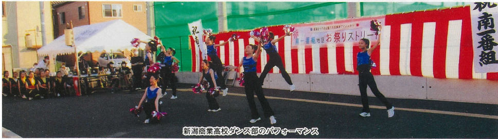
新潟商業高校ダンス部のパフォーマンス