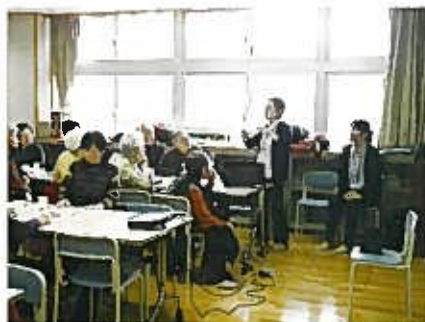
認知症を理解でき熱心な説明で勉強になりました。