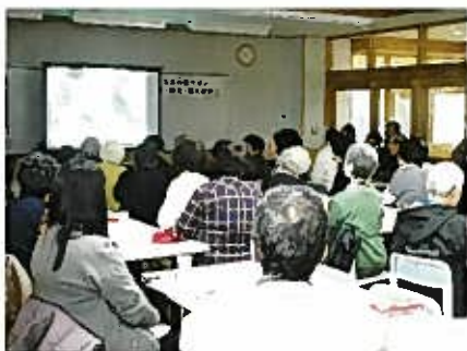
・自信を無くすような言葉かけを避ける ・感情を持った記憶は忘れにくい ・急がせない・シンプルに