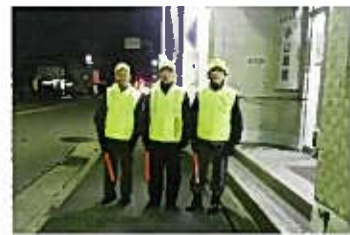
横七番町一パトロール