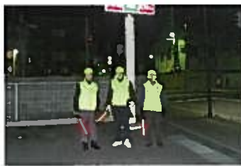
本町十四番町コンビニ前