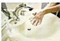
しっかり手を洗う

帰宅時、トイレ後、調理前、食事前には、石けんで30秒以上もみ洗いして、手洗いは、指先、爪のあいだ、手の甲、手首までしっかり洗い、タオルは常に清潔なものを使ってください。