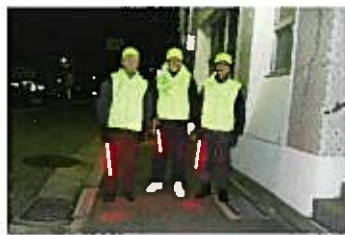
横七番町通パトロール