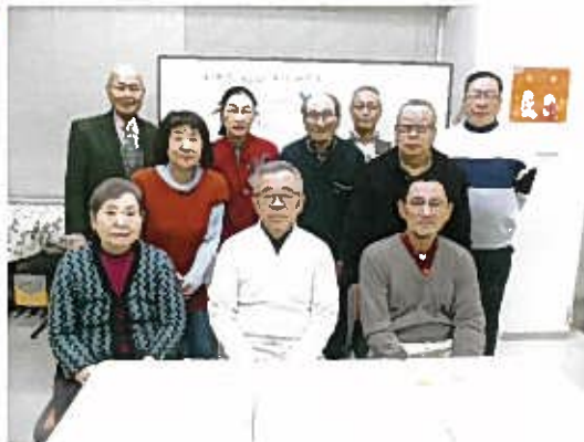
地域の夜回り状況で気づいたことを話し合い4月からの活動を確認しました。 【二葉コミュニティハウス】