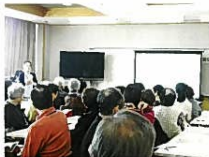
・看護師自身の体験をまじえての説明は大変良くわかりました ・人への理解・優しいかわり方、認知症の予防・快刺激で笑顔に ・役割・日課を持つ・褒める・褒められる