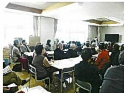
・脳の働き、認知症の方への話しかけ説明