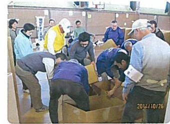
避難所設営の訓練