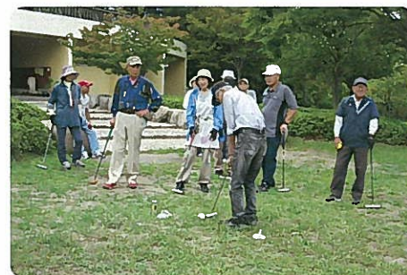
第1回トリットボール大会

トリットボールはゲートボールの道具を使い、ゴルフのようにコースを回って打数を競う新潟生まれのスポーツです。