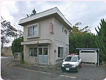
迷いごと、困ったときには「女池交番」へ