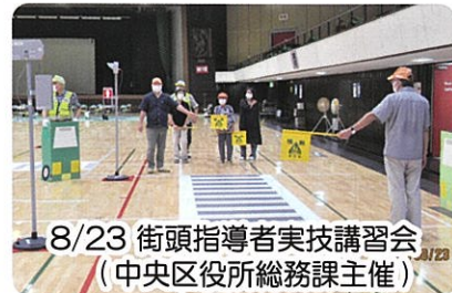
8/23 街頭指導者実技講習会（中央区役所総務課主催）