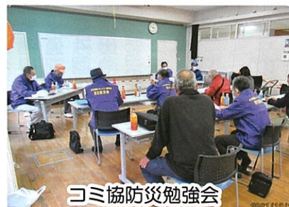
コミ協防災勉強会