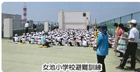
女池小学校避難訓練