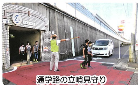
通学路の立哨見守り