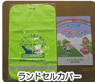
ランドセルカバー