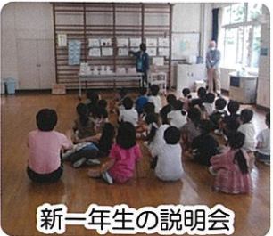
新一年生の説明会