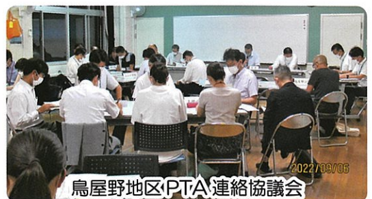
鳥屋野地区PTA連絡協議会