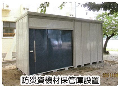
防災資機材保管庫設置

両校とも導入に先駆けて、令和3年度にモデル校の指定を受け、学校運営協議会が設置されて現在まで、保護者・地域・学校が一体となって子どもの成長をサポートしています。女池コミ協の役員も地域の代表として両校から学校運営協議会の委員委託を受けており、「地域とともある学校」づくりのために学校と連携している行事の一部を紹介します。