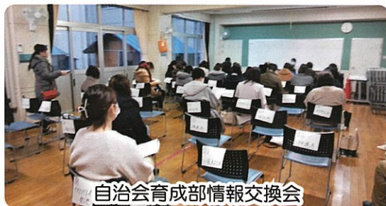
自治会育成部情報交換会