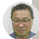
女池校区コミュニティ協議会会長