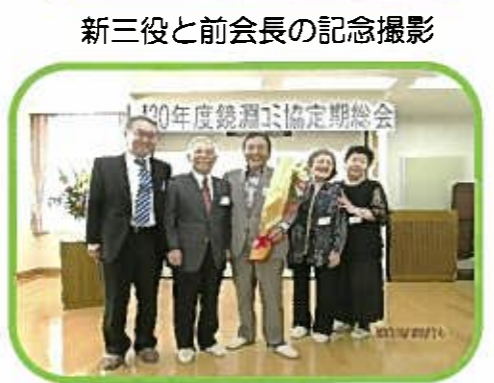
新三役と前会長の記念撮影