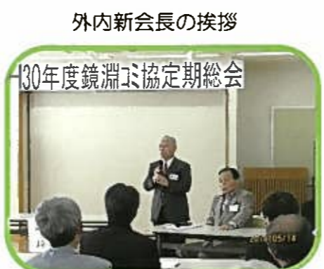
外内新会長の挨拶