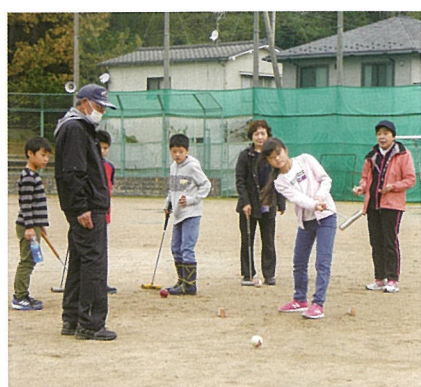
トリットボール大会

十月十九日、浜小グラウンドで表記大会を開催しました。保護者を含む一般参加二十八名、児童三十五名、スポーツ振興会役員、協会役員十二名計六十五名で②ホールのパ③コースを二ラウンド回り薄曇りの日でありましたがグラウンドに歓声が上がりました。なんとホールインワンが子供達にも出て大人顔負けのプレーが続出!!大会役員さんの配慮で全員が入賞品を頂きました。本競