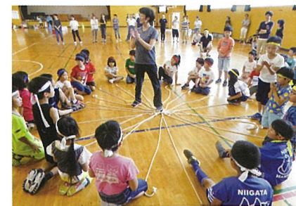
親子ふれあい運動会