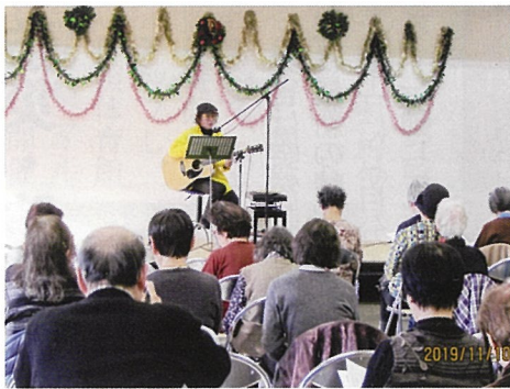
うたごえミニライブ

秋晴れの、令和元年11月10日関屋地区公民館において、地区民生委員児童委員との共催で「ちいきのつどい」笑って、歌って、楽しんで「を行いました。当日は天候にも恵まれ、多くの方々と第一部、包括支援センターによる介護の話。GENKI体操で身体をほぐし。第二部は、信濃町喫茶どん底のマスターによる「うたごえとミニライブ」として、懐かしのメロディーを皆で歌って、楽しかった一日を過ごすことが出来ました。