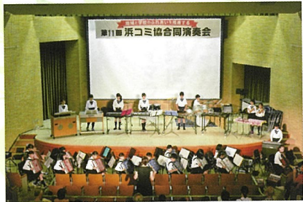
浜浦シンフォニーの合奏風景

最後に今年も浜コ協合同演奏会に参加できありがとうございました。来年も楽しく演奏できるように、これからも練習を頑張ります。