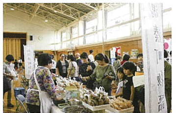
大盛況のマルシェ

中央区の「しもまち」地域において、豊照体育館とアイアップし、「豊照体育館周年祭マルシェ」を開催