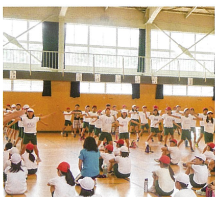
ラジオ体操講習会