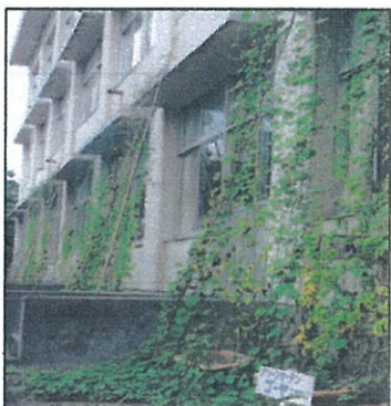
グリーンカーテン

十月二十二日、浜浦小学校一年生棟、三クラス窓際に「ゴーヤ」の苗を植えました。エコ対策の一助と、快適に勉強してもらいたいとの親心での作業でした。浜浦小学校区コミュニティ協議会の役員と、スパー・コメリさんからの資材、肥料、プランター、支柱とゴーヤ育成の用具一式、支柱組立作業を、高野学店長代理、作業員一名で、立派に約半日かけて製作してもらいました。プランターに一年生全員で、植栽してもらいました。地域の人、スパーの人、子供たちの正に、三世交代作業でした。