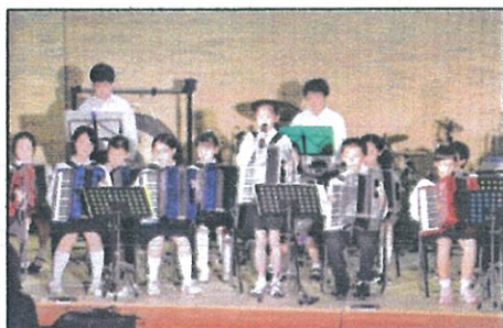
浜浦小学校 吹奏楽部演奏

九月二十五日、秋晴れの下、今年で三回目の浜浦小学校吹奏楽部、関屋中学校吹奏楽部、日本歯科大学軽音楽部OB会による合同演奏会が日本歯科大学の講堂にて開催されました。