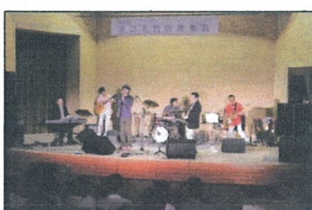
日本歯科大軽音楽部OB会 Fifty Storms 4 演奏

の演奏では軽快なトークと、素晴らしい演奏とブオーカルも素敵で大人の演奏を感じた等、それそれに絶賛を頂きました。演奏者の皆様有難うございました。当日、会場