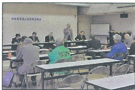
区長との意見交換会