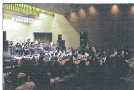
関屋中学校 吹奏楽部演奏

し、聴き応え、見応えが増しました。ご来場の方々からのアンケートの回答では、学校の演奏は練習時間が少ないのに、数多くの曲を仕上げた素晴らしかつ、良かった等と、中学校の演奏ではさすが全国大会で金賞の実力、一人一人の音楽性の高さ、技術力の高さに感動した、又、日本歯科大学OB会