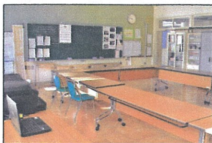
浜浦小学校に開所した事務所

長年の夢でありました浜浦小学校区コミュニティ協議会(略称・浜コミ協)の事務所を、昨年四月に浜浦小学校の第一会議室に開所しました。市開所に当たっては、市役所と浜浦小学校の全面的なご協力をいただきました。事務で使用するパソコンとプリンターは市から貸与して頂き、小学校からは会議室をはじめ、事務機と椅子、会議用の机と椅子を貸与していただきました。