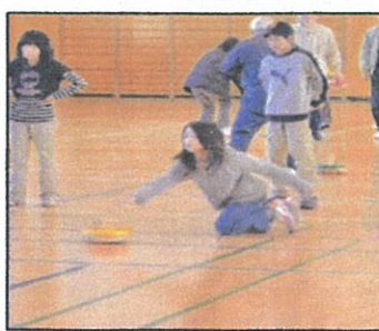
プレイを楽しむ児童たち

十一月二十七日(日)、かねてより企画していた浜コミ協主催によるフロアカーリング体験研修会を浜浦小学校体育館で実施しました。カーリングといえば、あの氷上で行うスポーツを連想するかと思いますが、滑らすストーンはフロッカーという木製で下面にキャスト(三個付、四個付)がついているため、まっすぐには滑らず、いかに左右のカーブを計算しながら六個のフロッカーを対戦相手チームより