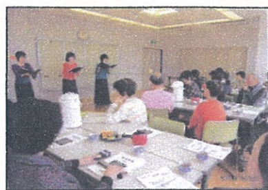
ふれあいを楽しんでいます

べり・踊り・ミニコンサートなどを一緒に楽しむ、和やかな時間を一緒に過ごしています。