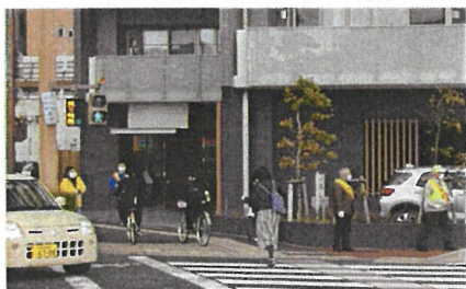
はじめての自転車登校

4月8日春の交通安全運動の声かけを行いました。はじめての自転車登校の高校生に安全運転をお願いしたり、小学生には体が大きく見えるように手を上げて横断歩道を渡るように指導しました。