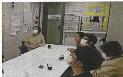
新しいコミ協事務所に集まって

4月8日春の交通安全運動の声かけを行いました。はじめての自転車登校の高校生に安全運転をお願いしたり、小学生には体が大きく見えるように手を上げて横断歩道を渡るように指導しました。