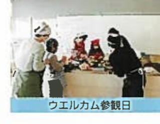
ウエルカム参観日

今年も、221名のボランティアにささげられ新潟市教育委員会「地域と学校パートナーシップ事業」に取り組み、今年で8年目の活動を無事おえることができました。 今年度は、延べ221名のボランティアの方から参加していただきました。 来年度も引き続き「学校が元気に！地域が元気に！そして子どもたちが元気に！」なるよう、さまざまな活動を行っていききたいと思っております。