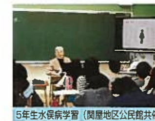
5年生水俣病学習 (関屋地区公民館共催)

今年も、221名のボランティアにささげられ新潟市教育委員会「地域と学校パートナーシップ事業」に取り組み、今年で8年目の活動を無事おえることができました。 今年度は、延べ221名のボランティアの方から参加していただきました。 来年度も引き続き「学校が元気に！地域が元気に！そして子どもたちが元気に！」なるよう、さまざまな活動を行っていききたいと思っております。