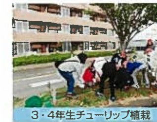
3・4年生チューリップ植栽