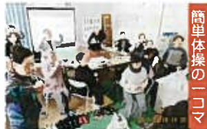
簡単な体操の110コマ

自由な交流の居場所 弥生有明伸よし会 ◆会場 弥生有明大橋町町内会館 ◆開催日 毎月第2・第4水曜日 午後1時30分から午後3時まで ◆参加費 1100円 ◆内容 ①毎回「水戸黄門」の主題歌を歌いながら足腰鍛錬の黄門運動を行います。②お茶とお菓子を出して、おしゃべりと近況報告を気楽に行います。③最後は、ハーモニカと大正琴を伴奏に若き日の思い出曲、唱歌、流行り唄などを皆で合唱します。 ◆年に数回、お年寄りの交通安全教室の開催、夏と冬に豪華なランチ会を開催しています。この時は大勢参加者があります。(少し個人負担あり) 毎回、12名前後で固定化の傾向があり、創意工夫を考えています。