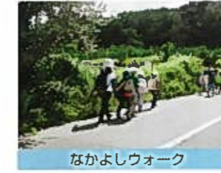
なかよしウォーク