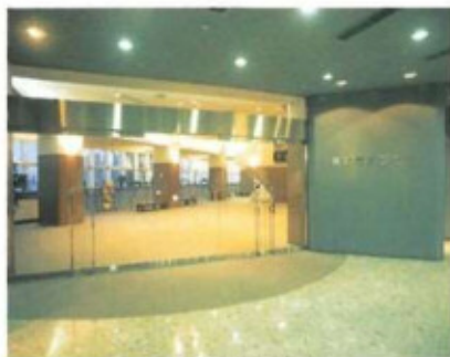
エントランスより