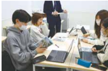
▲和気あいあいと話し合う学生

回 3月2日(土)、3日(日)午前10時～午後4時 ※同校のブースは、3月2日のみ。