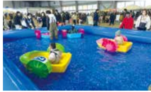
▲昨年度のイベントの様子

今回は、日和山浜魅力創出事業～ハマベリング!!!～に関わる新潟青陵大学・新潟青陵大学短期大学の学生も3月2日(土)に参加し、学生が作成したまち歩き冊子『今日の気分は?しもまち!』をブースで配布します。学生たちは「冊子の感想を直接聞くことができるので、イベントに携われて嬉しいです。多くの人から楽しんでもらえるような企画を用意して、皆さんの来場をお待ちしています」と元気に話し、期待に胸を躍らせながら企画のアイデアを出し合っていました。