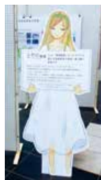
とやのちゃんのパネルが目印!

また、鳥屋野潟での取り組みや歴史に関する動画をYouTube=右の二次元コード=で公開しています。