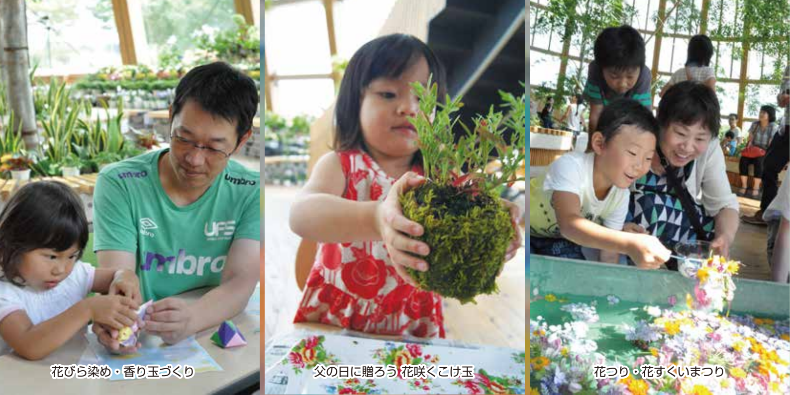
花びら染め・香り玉づくり