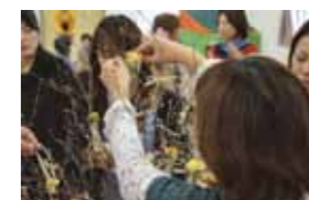
作ったオーナメントを飾りつける作業。「帰ったら子どもと一緒に作りたい」という声も。