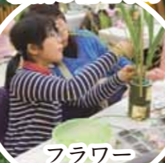
フラワー アレンジメント