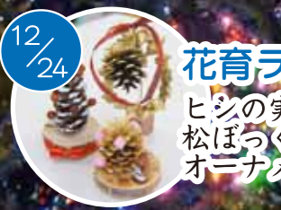
花育ランド ヒシの実や 松ぼっくりを使った オーナメント作り