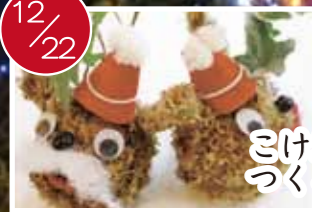
こけ玉サンタを つくる