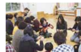
公演の後、オブジェ「オータムツリー」を制作。みなさんの笑顔が絶えませんでした。