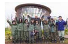
作業終了後にみんなで記念撮影。新潟オランダ協会の新美会長もともに。