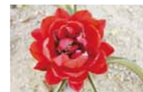
昨年咲いた新潟オランダ協会より寄贈された原種系のチューリップ。今年の春も楽しみです。