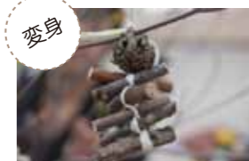
子どもたちが拾ってくるような、身近にある素材がオーナメントにかわいらしく変身。