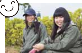
笑顔が素敵な学生たちが、花育の希望の星です。