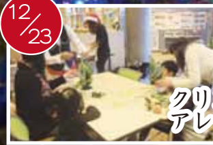
クリスマスツリー アレンジメント