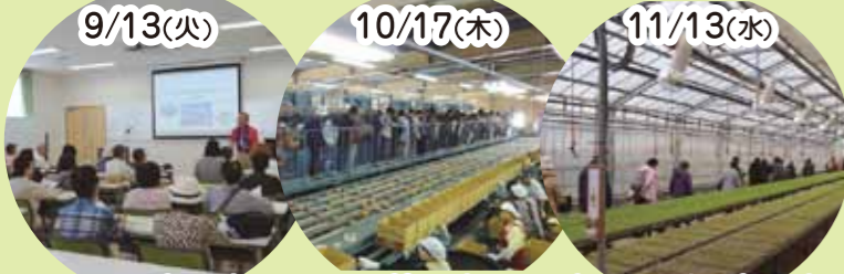
西区 & 南区編 西蒲区編 東区 & 江南区編

花や野菜の生産施設などの生産者とふれあいながら農業を身近に感じてもらうバスツアーを3回実施しました。