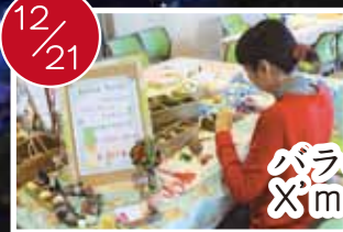
バラの香り舞う Xmasアロマテラピー