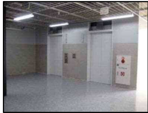
【写真10】来客用エレベーター