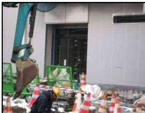
【写真13】店舗出入口（北側）②