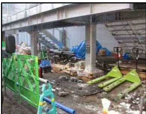
【写真15】1階駐輪場設置予定箇所