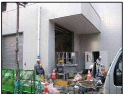
【写真14】荷さばき施設