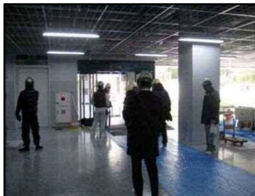
【写真2】店舗出入口（駅側）