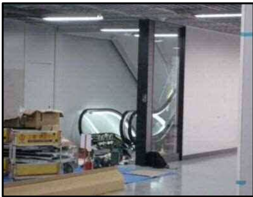
【写真11】エスカレーター