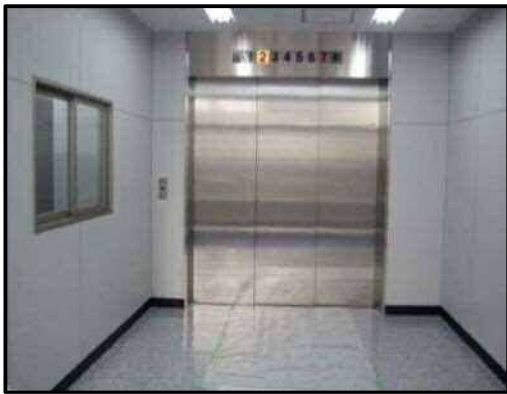
【写真9】荷さばき及び自転車用エレベーター