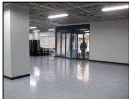
【写真12】店舗出入口（北側）①