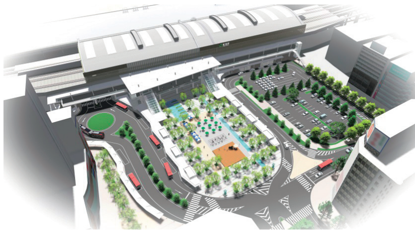
万代広場 (今後の検討・協議により変更する可能性があります)