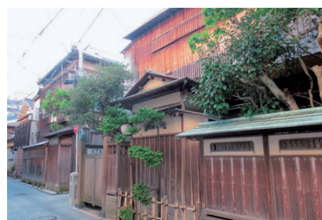
〔歴史的まちなみが残るふるまちながい〕