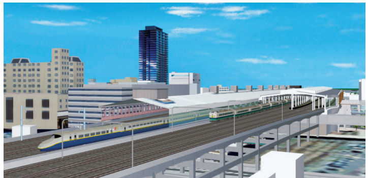
連続立体交差事業 (新潟駅周辺整備事務所)