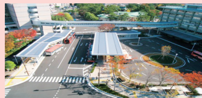
〔市役所ターミナル〕

上屋や防風壁を設置し、移動距離を極力少なくするなど、利用者の負担を軽減しています。