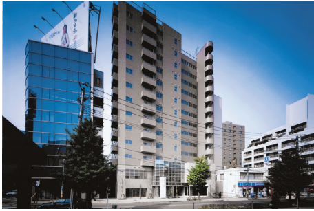
【寄居町地区 まちなか再生建築物等整備事業】

既存中心市街地である古町周辺地区に建築された築40年余りを経過した老朽マンションを建替え、優良住宅による都心居住の促進と公開空地による周辺環境の改善を図りました。