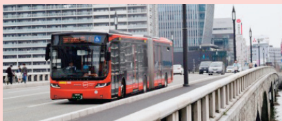
〔連節バス：愛称「ツインくる」〕

新潟駅前～青山間において、連節バス4台と一般バスを組み合わせで運行しています。今後も「基幹公共交通軸」の整備に向け段階的に取り組みます。