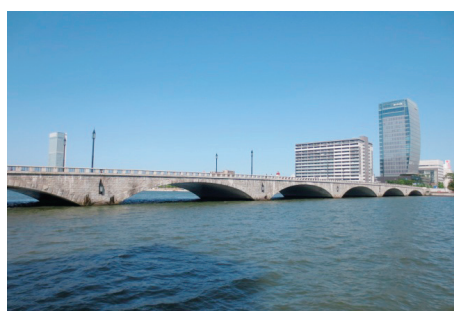
〔本市を代表する景観 ばんだいばし しののがわ〕

都市の魅力の一つとして、潤いややすらぎのある快適な都市環境が求められています。美しく個性的で魅力あるまちづくりを目指し、新潟らしい景観を「まもり、そだて、つくり、つたえる」ため、景観法に基づく「新潟市景観計画」と「新潟市景観条例」や、屋外広告物法に基づく「新潟市屋外広告物条例」を定め、総合的・計画的に景観形成を推進しています。また、市内各地域においては、それぞれの歴史と文化を活かした「修景」や「きめ細かなルール作り」を行うことによって賑わいと活力あるまちづくりを進めます。