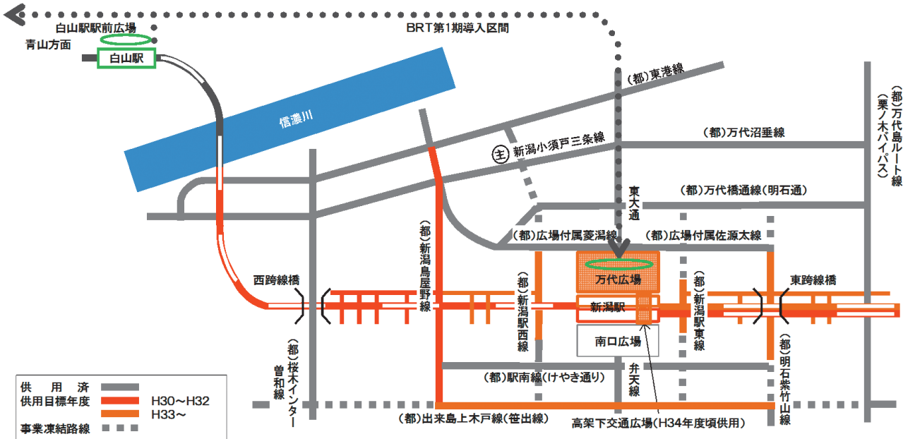
整備後のイメージ

新潟駅周辺整備事業は、日本海拠点都市にふさわしい都市機能の強化に向けて、鉄道在来線の高架化や幹線道路、駅前広場等の都市基盤をはじめ、駅周辺市街地の総合的な整備を図るものです。