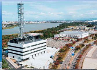
消防局・中央消防署

平成27年12月に、消防局・中央消防署の新庁舎が完成しました。(ウェルネスゾーン)