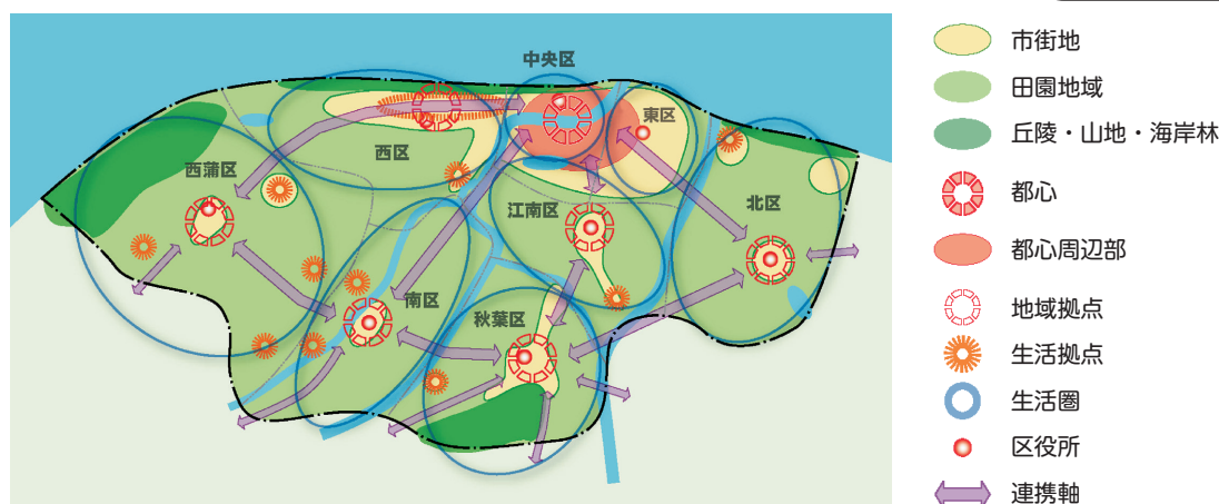
図 都市構造概念図

平成29年3月には、新潟市立地適正化計画を策定し、まちなかに望まれる都市機能や良好な居住環境の形成に向け、適正な土地利用を緩やかに誘導するための取組方針が示されています。