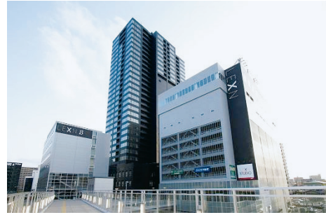
【新潟駅南口第二地区 第一種市街地再開発事業】

新潟市の陸の玄関口である新潟駅の南口において、広域交通拠点周辺地区としての立地条件を活かし、都心居住を目的とした住宅等を中心とする施設計画により事業を進めました。