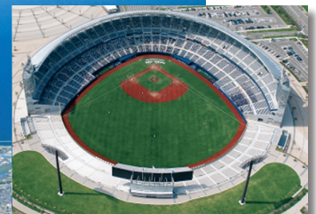
HARD OFF ECOスタジアム新潟

平成21年6月に「HARD OFF ECOスタジアム新潟」が完成し、プロ野球公式戦も開催されています。(総合スポーツゾーン)