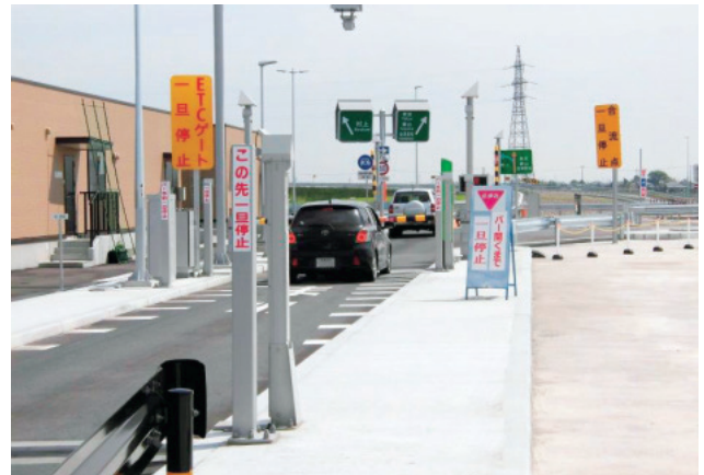
新潟東スマートIC (H28.3月開通)