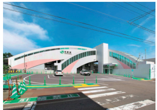
内野駅 (自由通路) 完了