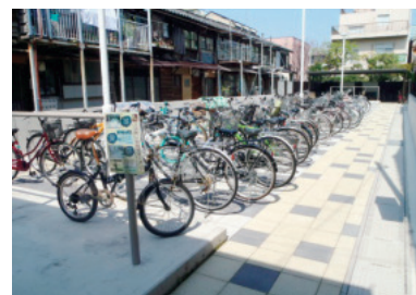
上古町自転車駐車場

これに基づき、車道の左側通行を啓発する自転車走行空間の整備（矢羽根等）や、駐輪場の整備、放置自転車対策、自転車利用ルールの周知を進めていきます。