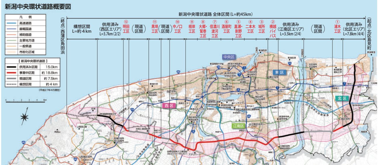
※この地図は、国土地理院発行の5万分の1地形図を縮小したものである。