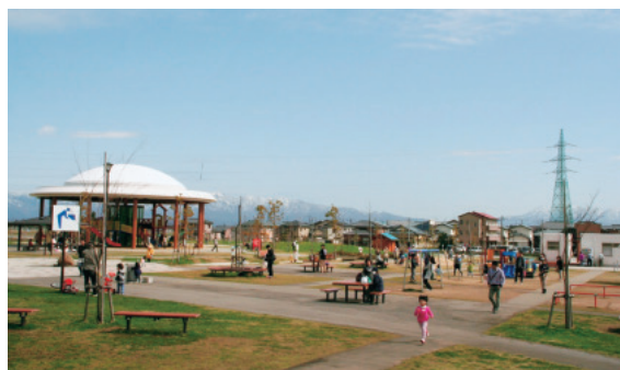
公園整備 (よごし公園)