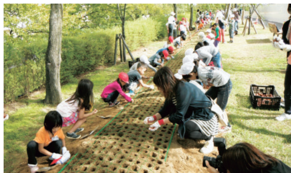
信濃川やすらぎ堤チューリップ植栽