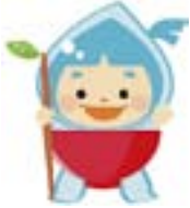
新潟市下水道キャラクター 水玉ぼうし

快適な環境づくりと安全・安心な暮らしを守るために、下水道処理区域の拡大、浸水対策の推進、下水道資源の有効活用を進めています。