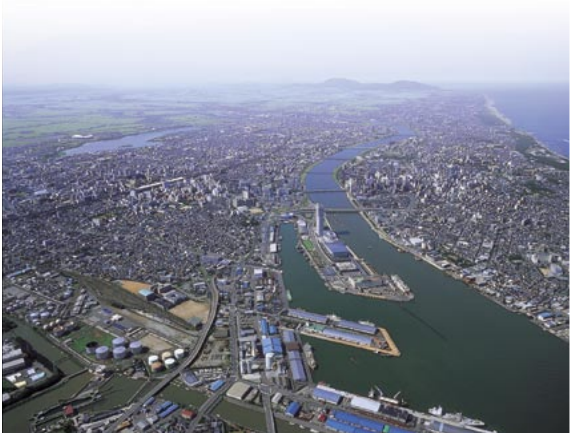
信濃川の河口・港上空から、新潟のまちを一望。