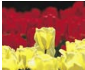
市の花 チューリップ

いつの時代も変わらない新潟の大地を包む雄大な夕日をもとに、大小の赤い月の形はアジア大陸と新潟を、白い扇の形は日本海を表現、マーク全体でアジア大陸の国々をはじめとする海外へ向かう新潟を表しています。