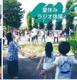
夏休み ラジオ体操