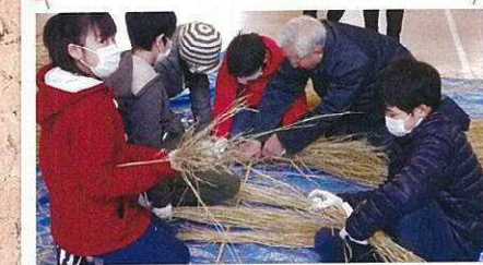
地域の皆様と小学5年生を中心に「とば」作成