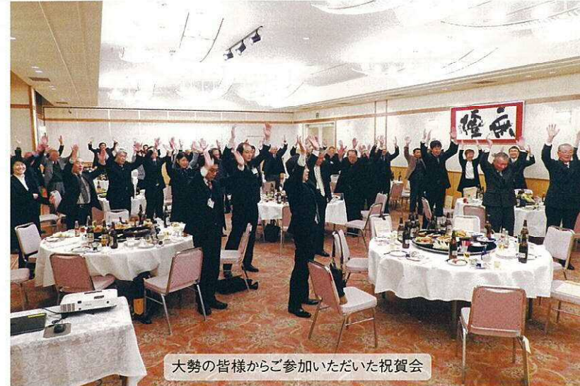
大勢の皆様からご参加いただいた祝賀会