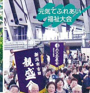
元気でふれあい 福祉大会