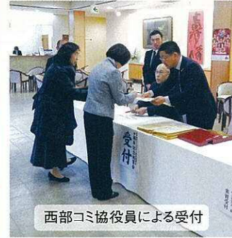
西部コミ協役員による受付