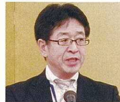
太田英次 副区長 (新潟市秋葉区役所)