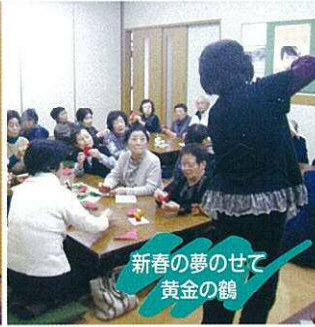
新春の夢のせて 黄金の鶴