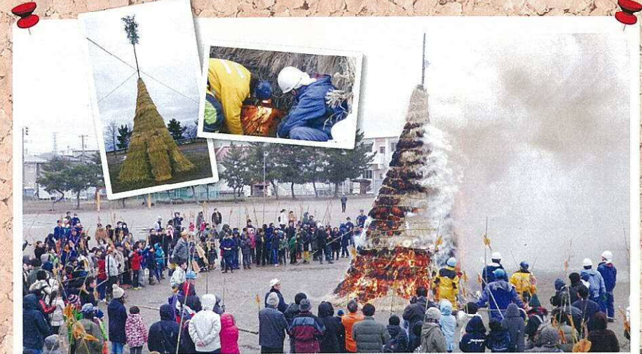
西部コミ協の目的でもある「世代間交流」事業。三小の全面協力にてグランド・体育館を使用

当初開催予定の2月11日(土)が強風のため中止となり順延。翌週の18日の開催となりました。制作日と当日を含め600名を超える地域の皆様からご参加いただき、無病息災を祈念することができました。ご協力・ご参加いただきありがとうございました。