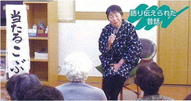
語り伝えられた 昔話