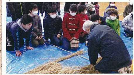
大先輩の指導による制作