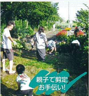
親子で剪定 お手伝い!