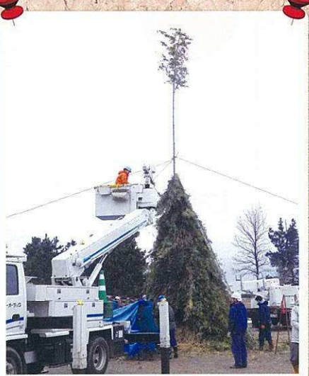
安全第一「高所作業車」を使用